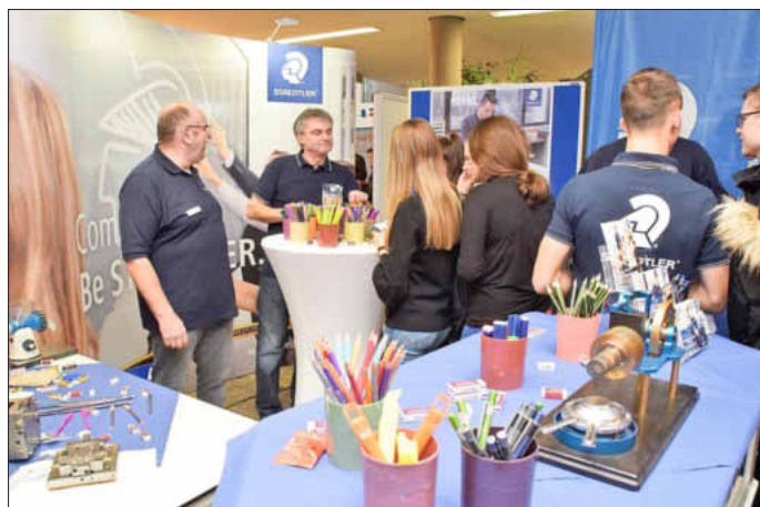
Mitarbeiter der einzelnen Firmen gaben gerne Auskunft über die jeweiligen Ausbildungsberufe.