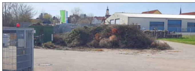
So bitte NICHT!