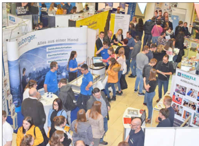
Volles Haus vermeldete die Uffenheimer Christian-von-Bomhard-Schule beim Berufsinformationsabend. Aussteller aus Unter- und Mittelfranken präsentierten sich den 1200 Besuchern, die aus dem Raum Würzburg, Ochsenfurt, Bad Windsheim, Rothenburg und Creglingen kamen.