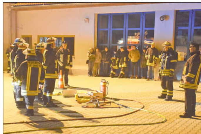
Viele Stunden ihrer Freizeit opferten die Feuerwehrler auch im vergangenen Jahr für Aus- und Weiterbildung.