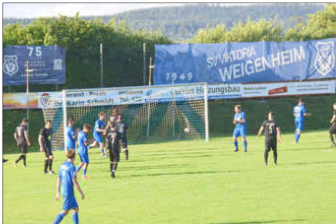
Und wieder zappelt der Ball im Netz. Der SVV Weigenheim (blaue Trikots) besiegte den SV Hüttenheim mit 4:0 Toren im Eröffnungsspiel.